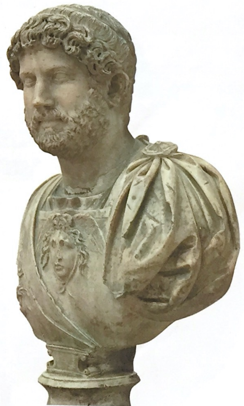
Busto del emperador Adriano, procedente de Itálica, siglo II. Museo Arqueológico de Sevilla.