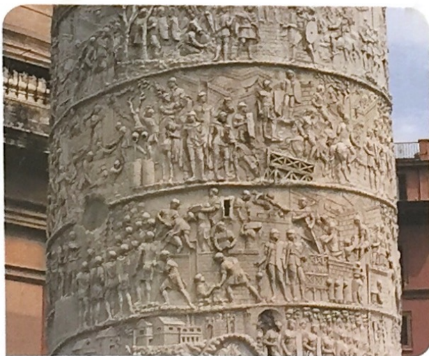
Detalle de la Columna Trajana en Roma, donde se aprecian distintos episodios de la conquista de la Dacia.

Trajano fue nombrado emperador en el 98 d.C. con el apoyo de las legiones, el Senado y el pueblo romano. Por entonces, la economía de Roma no era muy solvente, por lo que el flamante emperador tomó la decisión de conquistar la Dacia (actual Rumania), que contaba con minas de oro y plata. Los recursos obtenidos con esta campaña permitieron sanear la economía, reconstruir el foro de la capital y financiar medidas de interés público. Además, bajó los impuestos y condonó deudas a los ciudadanos.