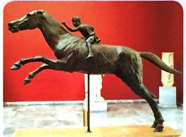
El caballo y el pequeño jinete del cabo Artemisión, escultura griega en bronce (h. 140 a.C.). Atenas, Museo Arqueológico.

tenían doce años no gastaban túnica ni se les daba más que una ropilla para todo el año; así, macilentos y delgados en sus cuerpos, no usaban ni de baños ni de aceites, y solo algunos días se les permitía usar de este regalo. Dormían juntos en fila y por clases sobre mullido de ramas, que ellos mismos traían, rompiendo con la mano sin hierro alguno las puntas de las cañas que se crían a la orilla del Eurotas. Y en el invierno echaban también de los que se llaman matalobos, y los mezclaban con las cañas, porque se creían que eran de naturaleza cálida».