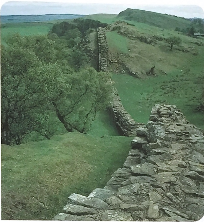
Muro de Adriano en Inglaterra, siglo II. El emperador mandó construir esta muralla para defender la Britania romana de las belicosas tribus del norte.

pero, a la larga, Roma no lograría contener las avalanchas migratorias que se sucederían a partir del siglo III. El ejército y los muros se revelaron insuficientes para contener a pueblos enteros que, empujados a menudo por la necesidad o la presión de otros pueblos, cruzaban las fronteras romanas en busca de tierras que asegurasen su subsistencia.