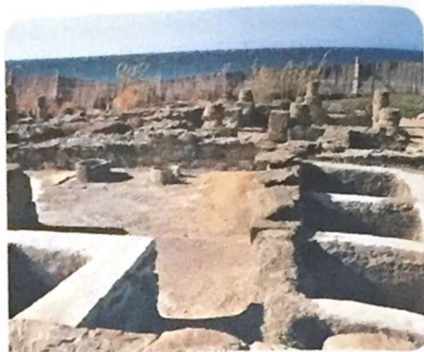
Factoría de salazones y garum de las ruinas romanas de Baelo Claudia , Tarifa (Cádiz).

El pescado se utilizaba para prepararlo en salazón y además era la base para fabricar el garum , una especie de salsa o condimento de enorme importancia en la cocina romana al que también se atribuían virtudes medicinales. Baelo llegó a contar con cinco factorías para elaborar este producto.