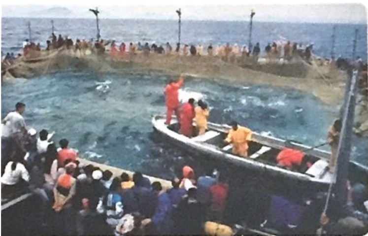
Almadraba en la actualidad.

En el Estrecho la pesca siempre ha sido muy abundante, especialmente en verano, cuando los atunes emigran desde el Atlántico al Mediterráneo. Como se sigue haciendo en nuestros días en la costa de Cádiz, los habitantes de la zona aprovechaban esta época para capturarlos mediante el arte de la almadraba .