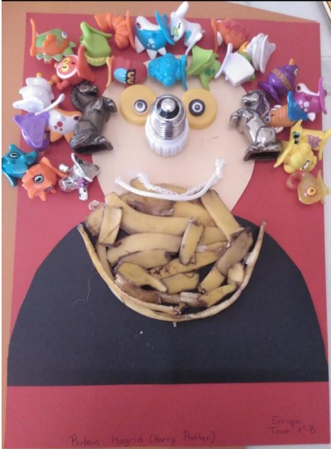
Rubeus Hagrid (Harry Potter)