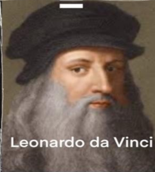
Leonardo da Vinci