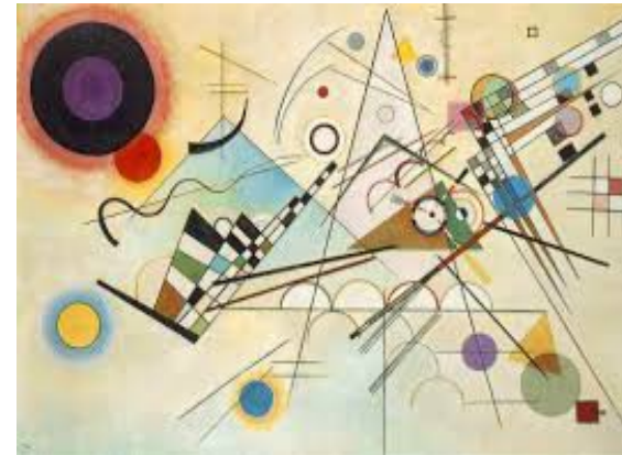
Composición 8 , Wassily Kandinsky