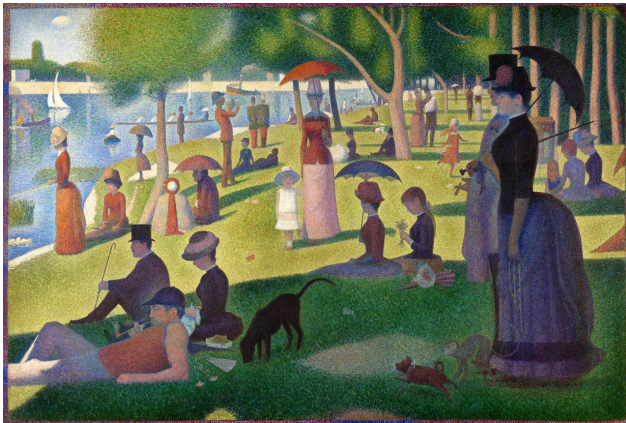
Tarde de domingo en la isla de la Grande Jatte , Georges Seurat