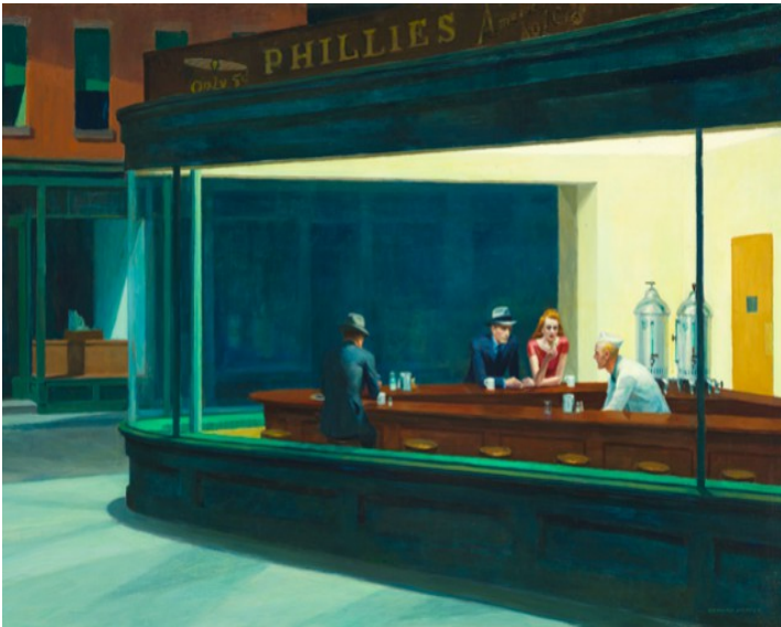
Noctámbulos , Edward Hopper