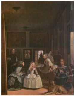
Figura 7.1. Es importante diferenciar la forma del estilo. Observa la imagen superior, un cuadro de Velázquez. ¿Qué autor moderno pintó el mismo cuadro manteniendo la estructura del mismo, pero con un estilo completamente diferente? Por si te sirve de ayuda, en la web encontrarás más información sobre el cubismo, una de las primeras vanguardias artísticas.

Si te das cuenta, las frases no están ordenadas de forma lógica, por lo que el diálogo carece de sentido. Necesita que le « demos forma ».