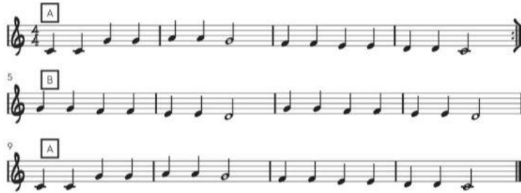
Campanitas del lugar

¿Sabes que sobre la famosa canción Campanitas del lugar , Mozart realizó unas variaciones para piano? A continuación tienes la melodía. Observa que tiene una forma ternaria: